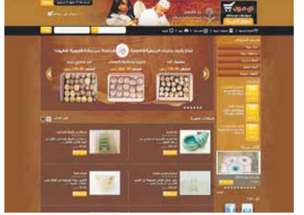
الموقع الإلكتروني لمؤسسة البريد السعودي (اليوم)

الحرفيون والأفراد، والجمعيات النسائية وغيرها من مراكز الإنتاج الحرفي، وتهدف أيضاً إلى زيادة الدخل وتوفير فرص عمل للأسر المنتجة، وذلك من خلال تشجيعها على تطوير منتجاتها وتسويقها إلكترونياً عبر سوق القرية على الرابط www.e-mail.com. في الموقع الإلكتروني لمؤسسة البريد السعودي. ويقول