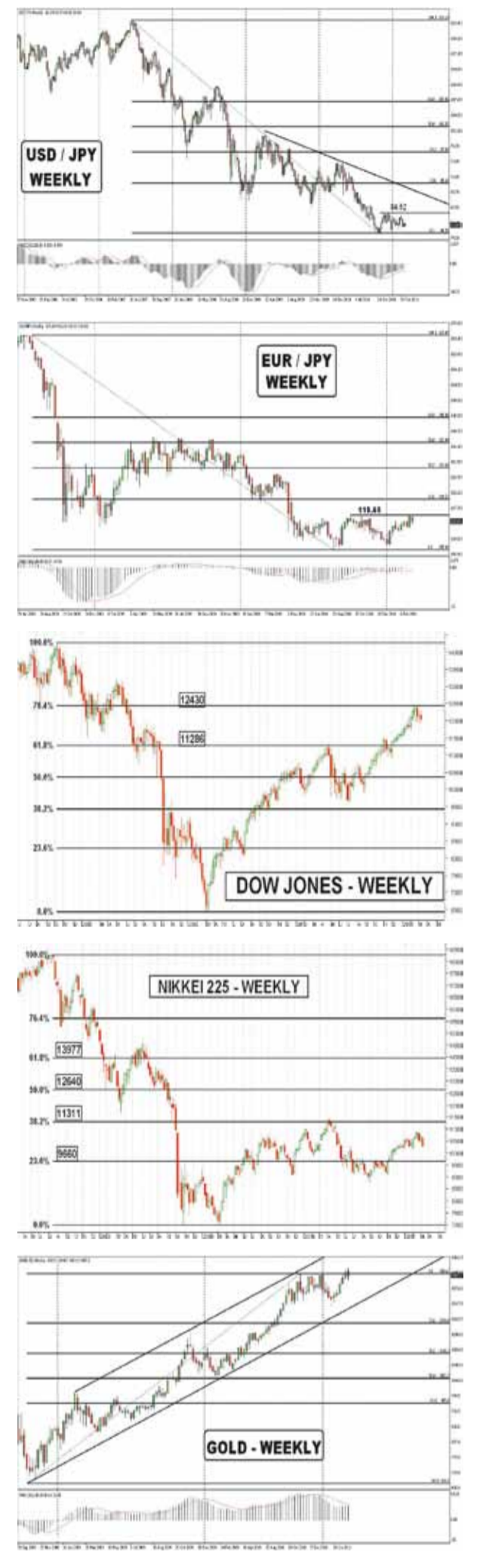
مؤشر النيكبي الياباني

اليورو مقابل الين الياباني أغلق اليورو أسبوعه الأخير على انخفاض أمام الين الياباني وذلك بعد تراجعه قرابة الـ 135 نقطة حين أغلق عند مستويات 113,83 واللافت أن السعر لم يستطع اختراق مناطق المقاومة حاليا مع اقترانه بأمر لوقف الخسارة يكون أدنى من ذات المستويات التي ستتحول دعما بمجرد اختراقها.