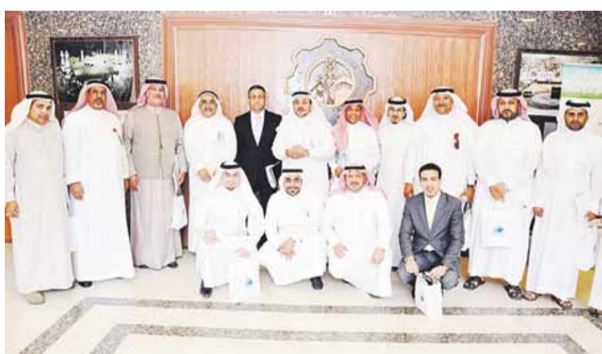
اليوم تنطلق فعاليات ملتقى التوظيف الأول برعاية فيرمونت رافلز. (اليوم)

تحت رعاية صاحب السمو الملكي الأمير خالد الفيصل أمير منطقة مكة المكرمة تنطلق اليوم فعاليات ملتقى التوظيف الأول في العاصمة المقدسة ويستمر لـ 3 أيام، بحضور عدد من الوزراء والمسؤولين ورؤساء الدوائر الحكومية ورجال الأعمال من مختلف مناطق المملكة. ويهدف الملتقى إلى المساهمة في بناء مستقبل الشباب السعودي عن طريق توفير فرص عمل مناسبة لهم، يؤمن من خلالها دخلاً مادياً مناسباً لتأمين حاجاتهم الأساسية والمستقبلية وتحقيق تطلعاتهم في الحياة وهذا ما لا يمكن تحقيقه إلا من خلال الحصول على فرصة وظيفية بما يتوافق مع قدراتهم ومؤهلاتهم ليستطيعوا الإبداع في مستقبلهم المهني، و يركز الملتقى على الشباب والشابات من منطقة مكة المكرمة ، حيث