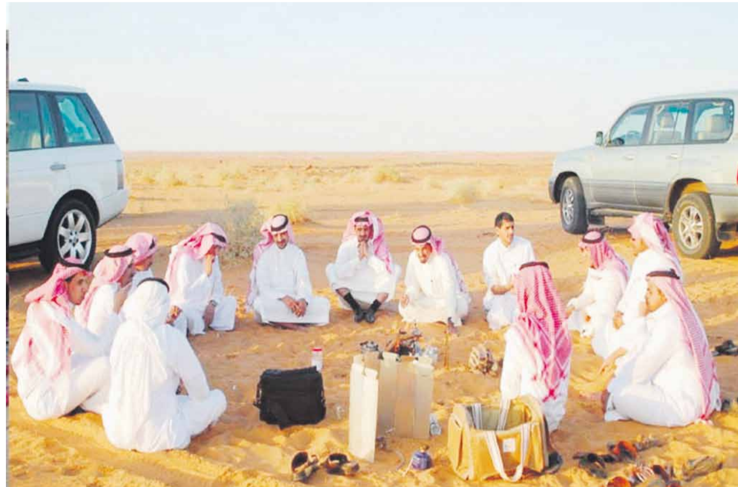
المرشدون السياحيون عنصر فعال في نمو الحركة السياحية