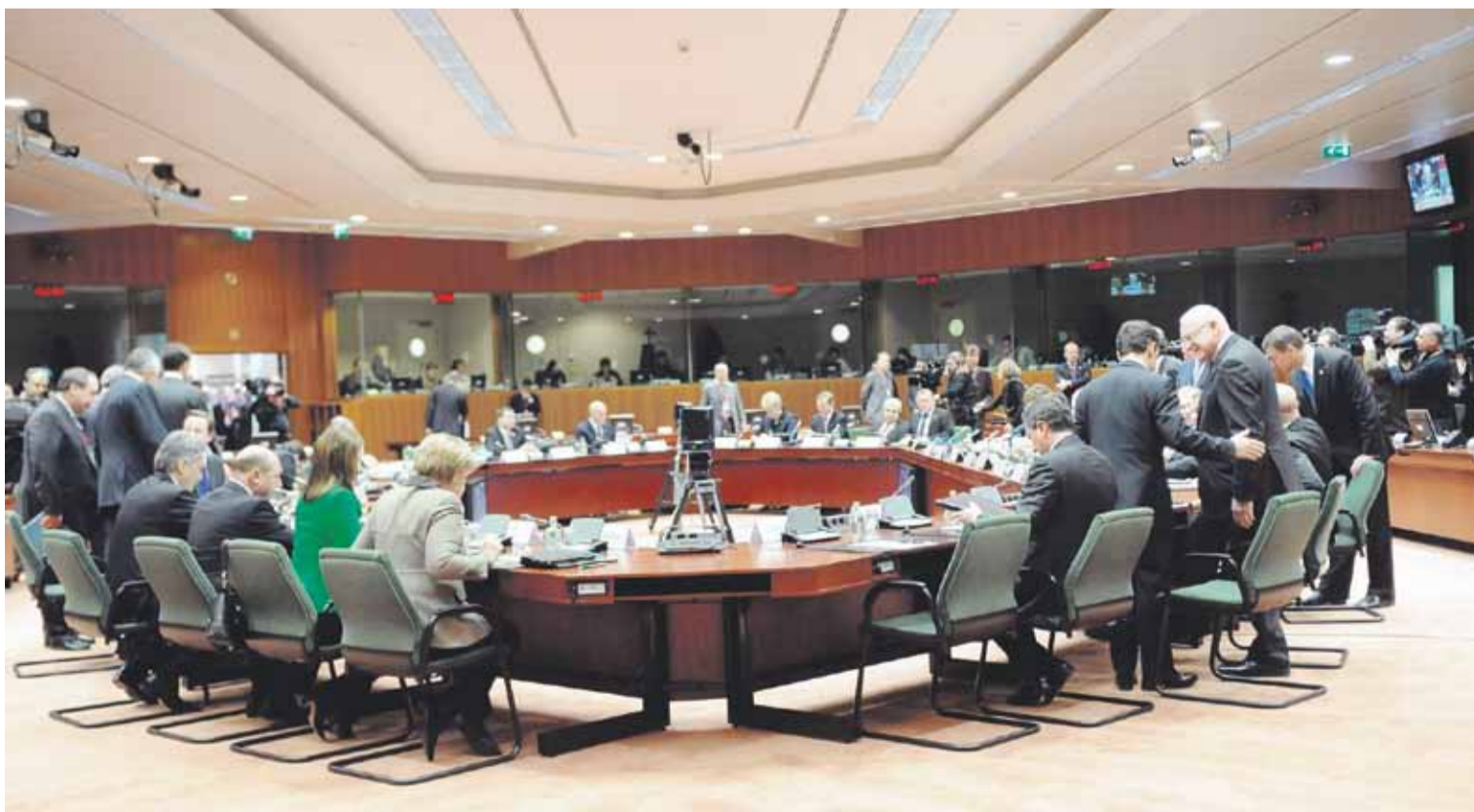
جانب من اجتماع قادة منطقة اليورو.

وقرر قادة منطقة اليورو خفض سعر الفائدة الذي فرضوه على اليونان لدى منحها قرض إنقاذ غير مسبوق في العام الماضي. وتدخلت منطقة اليورو في ذروة الأزمة المالية اليونانية بعرض 80 مليار يورو (110 مليارات دولار)، لكنها حددت سعر فائدة عقابي يصل إلى 6 بالمائة لضمان عدم تقدم أي دولة أخرى، بفعل إغراء الاقتراض، بطلب إنقاذ. وقبول هذا القرار الذي توافقت مع طلب بإجراء تخفيضات قاسية في الإنفاق، بانتقادات شديدة في اليونان، حيث اعتبر محاولة للترجح من الأزمة التي تواجهها البلاد. وقال رومباني إن دول منطقة اليورو وافقت على خفض سعر الفائدة بنسبة 1 بالمائة وتسهيل تاريخ استحقاق الدين لتسهيل العبء على الاقتصاد اليوناني الهش. وطلبت أيرلندا التي حصلت أيضا على قرض إنقاذ في العام الماضي، بالحصول على نفس الامتياز إلى أنها شلت في التوصل إلى اتفاق بشأنه. وقال دبلوماسيون إن هذا الفشل يرجع إلى مطالبة الرئيس الفرنسي نيكولا ساركوزي بأن ترفع أيرلندا في المقابل معدل الضريبة على الشركات وهو التنازل الذي رفضه رئيس وزراء أيرلندا الجديد إندا كيني رفضا قاطعا.