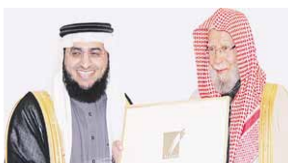
مدير عام أكاديمية الجزيرة يتسلم درع التكريم. (اليوم)

يُدعم الجيل الطموح لابتداء حياة مهنية في الحفل الإعلامي بالملكة أثير طيب في الحفل التكريمي، حيث تسعى دائماً أكاديمية الجزيرة العالمية للقيام بدورها لمساعدة شباب الوطن في تحقيق أحلامهم ودعم مسنوبي الإعلام الهادف، لاسيما وأن البرنامج يوفر لهم دورة عملية في التقديم الإعلامي، ووضعتهم في تجربة حياة أمام المشاهدين والحضور.