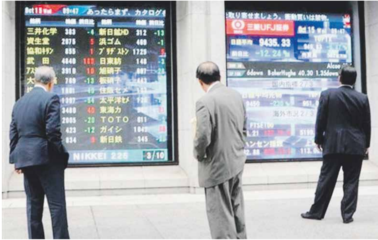
بعض الأشخاص يتابعون تداولات مؤشر النيكبي الياباني عبر الشاشات.

الذهب يتنازل عن قمته الجديدة والهدف مستويات 1500 دولار