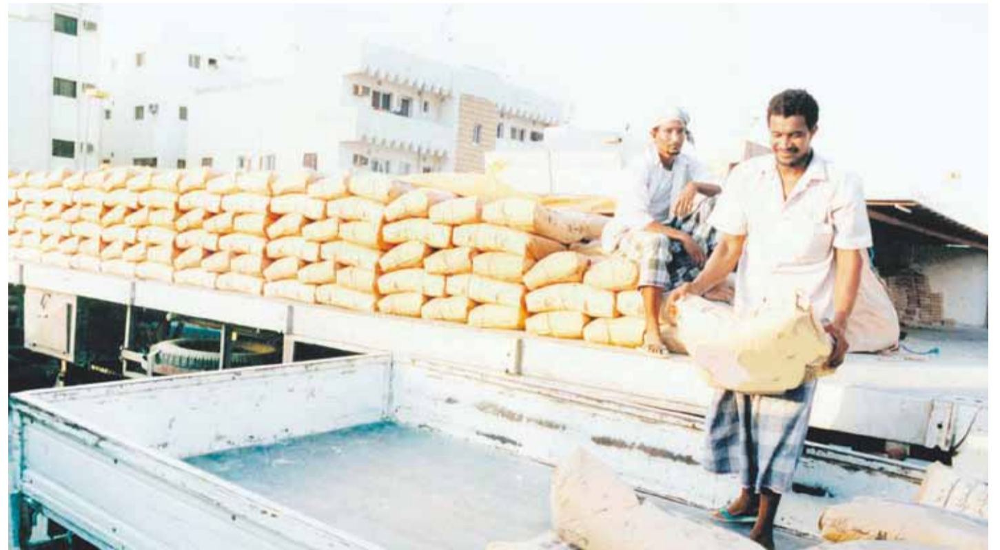
صناعة الإسمنت تواجه عقبات تعوق نموها