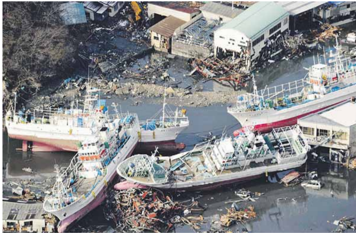
تأثر العديد من قطاعات الاقتصاد الياباني بالزلازل التي عرفت على إرهابها من الملكة

تنسق مع الجهات المسؤولة لمتابعة أوضاع الصادرات السعودية